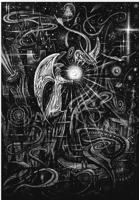
Рисунок С. Бедусенко

Его – неизлечимого больного, Чтоб он воспрянул к жизни, нов и чист, – В немеркнущих лучах Святого слова.