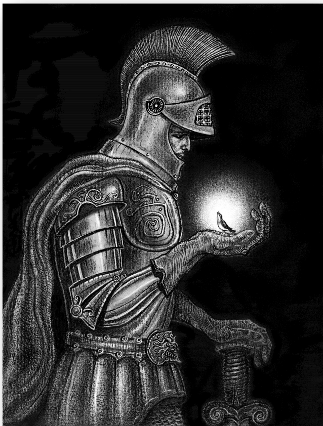
Рисунок С. Бедусенко